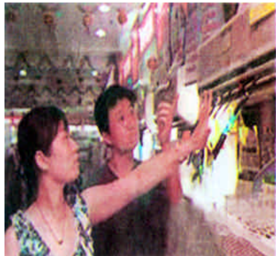
天气炎热，北京空调销售剧增