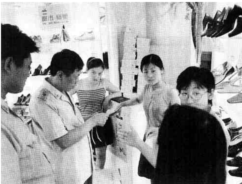
7月11日,市消费者协会接到投诉,西城某鞋店没有履行承诺,致使顾客买了几天的鞋子“开帮”,店方缝合后承诺若再开裂“包退”。但是几天后鞋子又开帮,当顾客又来到鞋店交涉时被店方断然否认以上承诺。无奈之下,顾客只好通过“12315”告到了消协,得到了满意处理,维护了消费者的合法权益。 (延智)

这时贪婪的小偷正在搜寻下一个行窃目标。当发现突然到来的武警战士时,扭头向东快步离去。老大爷手指这个仓惶而逃的青年人向战士喊:“就是他——他偷了我的钱!”这时教练周庆彬大喊一声:“哪里跑!”穷凶恶极的小偷见势不妙,一边没命地逃窜,一边将偷来的钱向后猛摔,妄图乘机逃跑。战士梁海明不顾一切、奋起直追。当快要追上时,梁海明一个前扑,一拳打在小偷的后背,未等小偷站稳,梁海明又一个左侧拳,右脚一个漂亮的勾踢,将小偷打倒在地。这时,从后面赶过来的战士一同把小偷擒获,把小偷抛洒在地的人民币一张不少地捡了起来,并拨打了“110”报警电话,将小偷移交给了当地警方……。(吴南 清国)