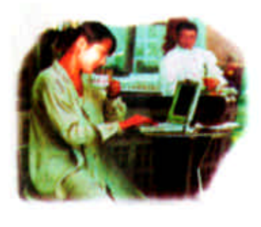
我们用创意诠释您的品牌

赫伦说,对平托还有两个月的禁赛将延期一年,如果在禁赛期间再发生类似事件随时追加。 平托是里斯本体育队的球员,代表葡萄牙队参加了韩日世界杯赛。6月14日在小组赛对东道主韩国队的比赛中,因从背后铲倒对方球员而被裁判红牌罚下。平托不服判罚,在退场时殴打裁判。这场比赛韩国队1-0获胜,这一结果使葡萄牙队无缘小组出线,而韩国队最终闯进了半决赛。