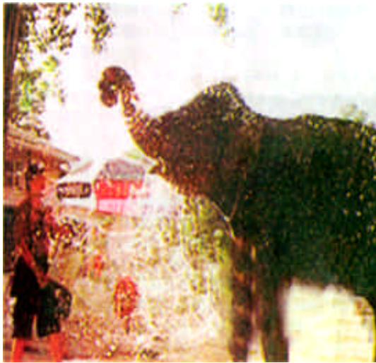
上海动物园工作人员为大象浇水降温