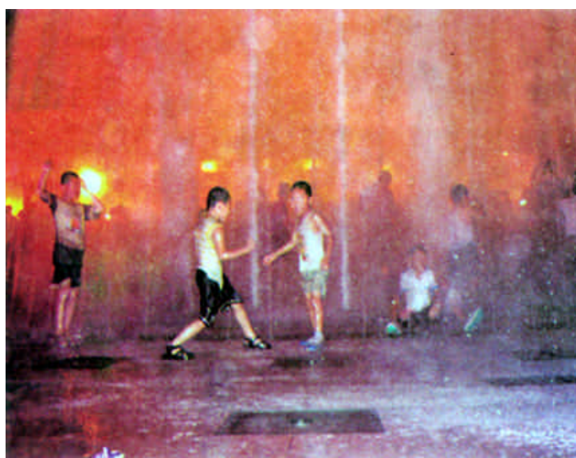
天热难耐，孩子们纷纷钻入新世纪广场的喷泉中。

连日的高温使各地的人们仿佛置身蒸笼之中，痛苦不堪。这几天，全国多个地方出现35摄氏度以上的高温天气。北京、石家庄等地出现了50年来最酷热的天气。