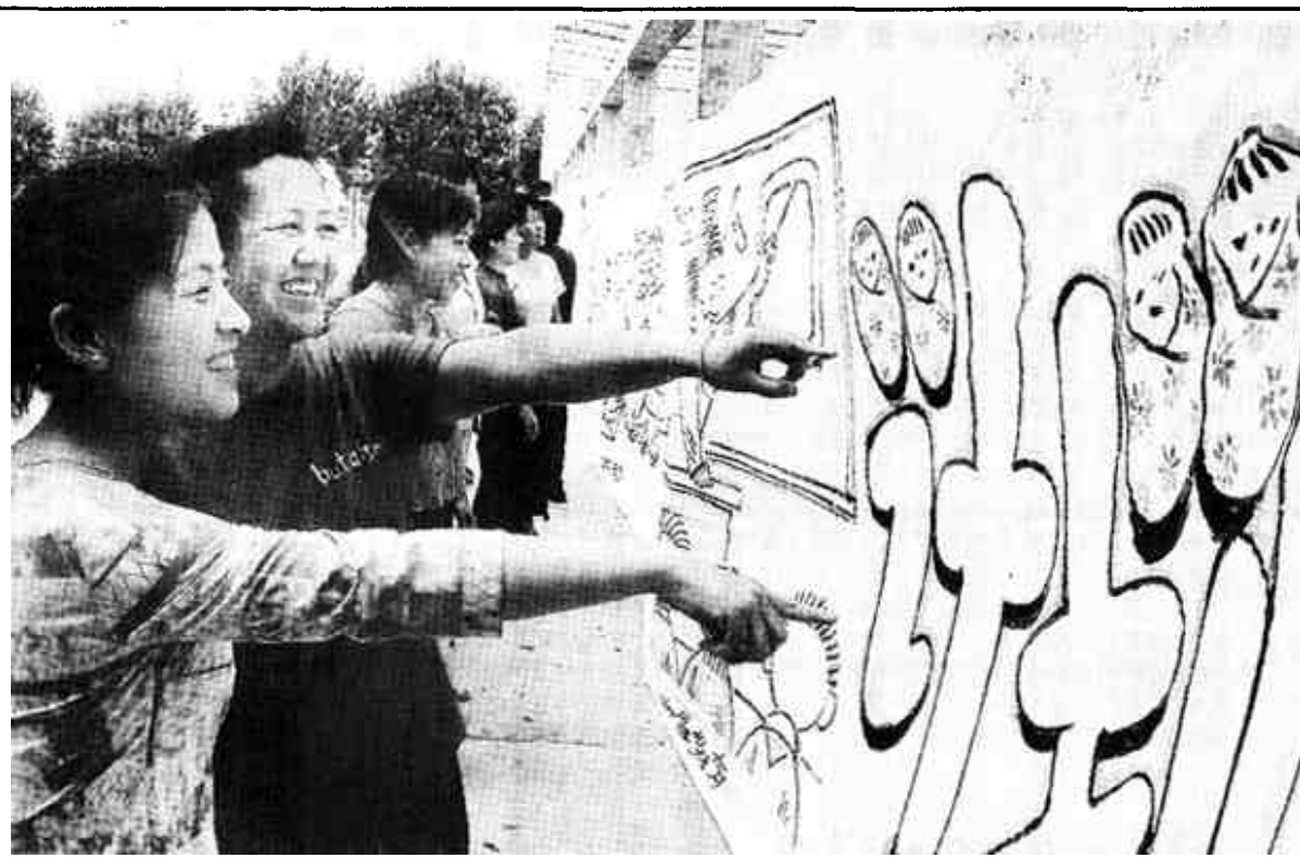
东营区辛店街道采取多种形式，开展丰富多彩的宣传教育活动。他们制作了长25米、宽2米绘制的15幅关于人口与计划生育内容漫画的计生宣传长廊...