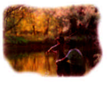
我们用手中的笔记记录您的成长