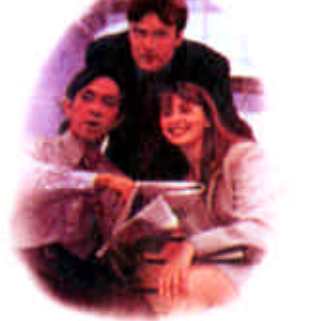
我们用劳动成就您的事业