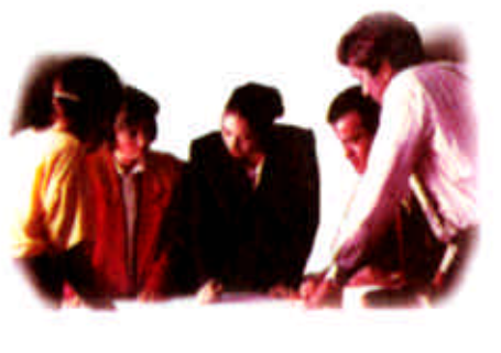
我们用策划提升您的形象