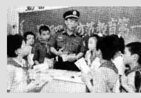
的民警兼任学校安全辅导员,在教室里为学生上课。

止学习,而非以考试来筛选、淘汰,这样的一种教育方法让孩子学得更轻松,没有太大的精神压力。 在儿童中心凉爽、明亮的计算机教室里,我们看到了一群7、8岁大的小孩正在摆弄着一些“玩具”。当他们把这些做好的“玩具”放上塑料跑道时,它遇到黑线会后退,有时又可以跟着黑线转弯。而孩子们就随着“玩具”的前进后退兴奋地叫着、蹦跳着。其实,这些看似玩具的模型实际上就是一种“机器人”。老师让孩子们自己动手、调查设计,搭建“机器人”模型、编程,培养他们分析问题、解决问题与独立思考的能力。同时,老师还把她们分成三人一组,培养她们与人协作、交流的团队合作精神。当记者问其中一名小孩好玩吗,他聚精会神的摆弄着手中的模型,头也不抬地说:“好玩,好玩。在这样的教学环境下,不仅摆脱了学习的枯燥乏味,还实现了寓教于乐的素质教育。”